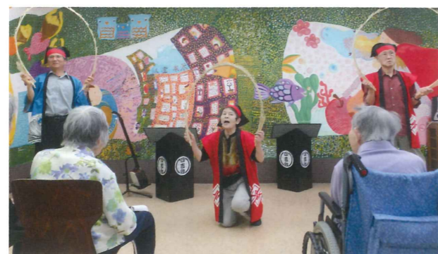
日本民謡山野会（日吉台民謡教室）玉すだれ