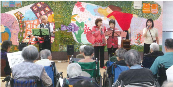
ボランティアグループ 唱の会

改革の視点は多様な事業主体の参入の為に社会福祉法人の存在意義が問われており、国民に対する説明責任を果たすこと。他の事業主体では対応できない福祉ニーズを充足することにより地域社会に貢献することが社会福祉法人の使命であること。以上の事から経営組織の見直しを図られ、